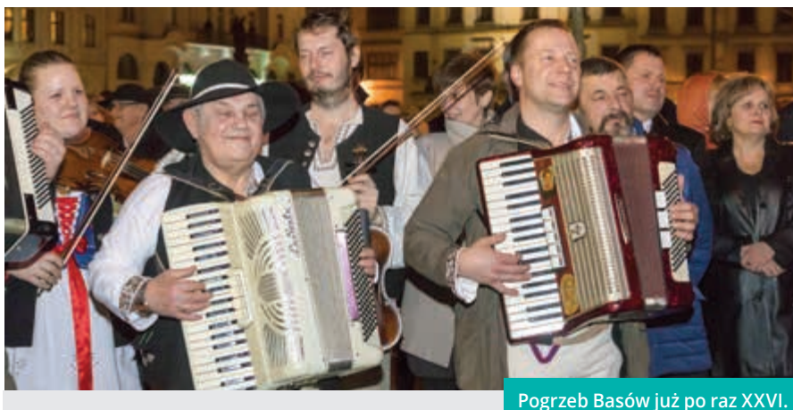
Pogrzeb Basów już po raz XXVI.

Tegoroczne wydarzenie organizatorzy poszerzyli o Przegląd Kapel Góralskich, który odbył się w wypełnionej po brzegi sali widowiskowej Cieszyńskiego Ośrodka Kultury „Dom Narodowy”.