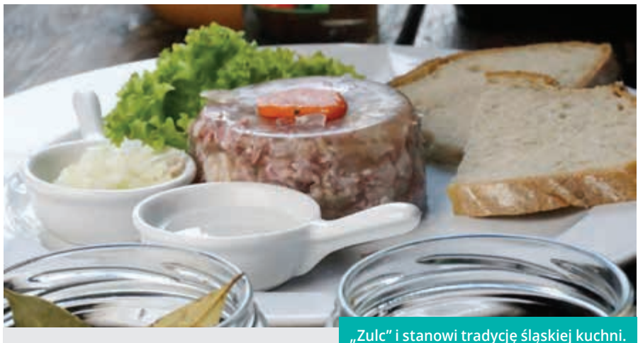
„Zulc” i stanowi tradycję śląskiej kuchni.

- Do serwowania regionalnych dań kuchni śląskiej zainspirowały nas osoby, które odwiedzają Cieszyn, ale również... jego mieszkańcy, władze miasta, lokalni działacze... Zawsze jesteśmy otwarci na głosy